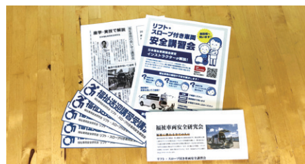
ステッカーやチラシの配布も行なっています