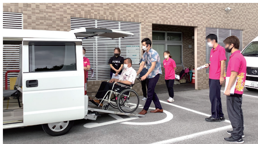
実車を用いたリフト・スロープ付き車両安全講習会の様子