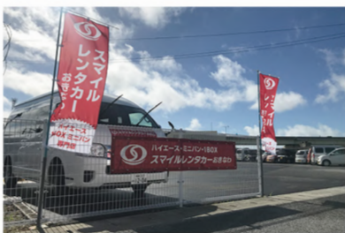
車のことならなんでもお任せ！沖縄支社