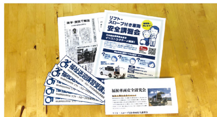
ステッカーやチラシの配布も行なっています