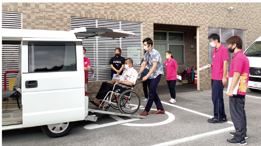
実車を用いたリフト・スロープ付き車両安全講習会の様子